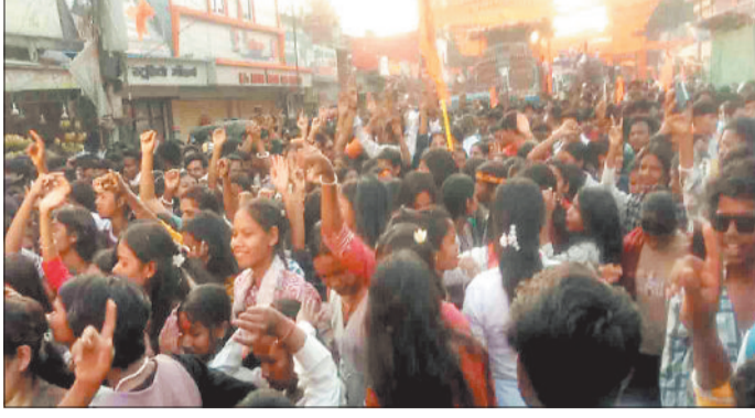
शोभायात्रा में श्रद्धालुओं की भीड़।