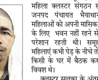
ऑपरेशन के पश्चात।