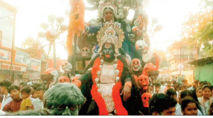
शोभायात्रा में शामिल झांकी।